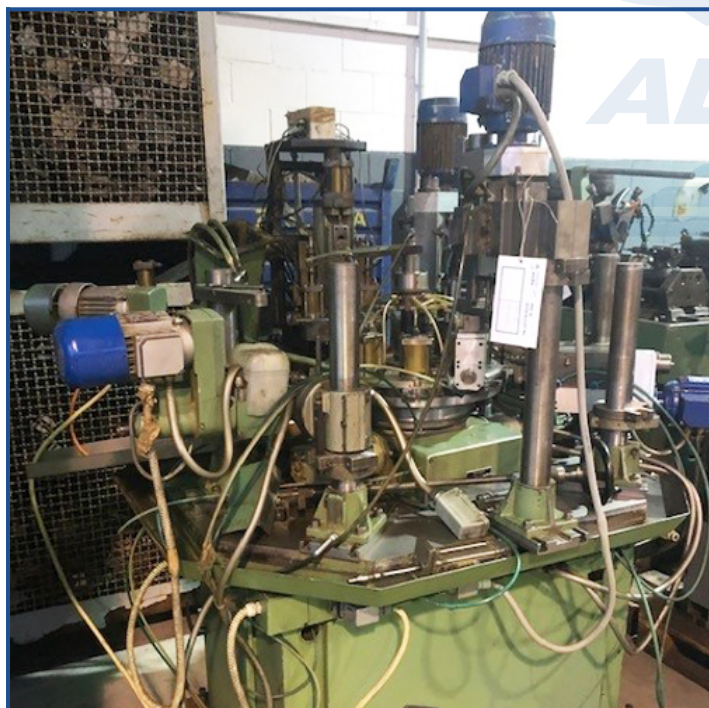
Tavola 8 stazioni con morse. Chiusura pneumatica. Nr. 7 unità verticali/orizzontali. Nr. 4 unità orizzontali/forare/filettare. Nr. 3 unità verticali/forare/filettare. Nr. 1 fresatrice a disco attrezzato spine luce max diam. 12,5. 3 unità verticali (forare/filettare/fresare), 4 unità orizzontali (3 forare 1 filettare). 8 morse pneumatiche a 2 ganasce. Max lunghezza del pezzo 60 mm.